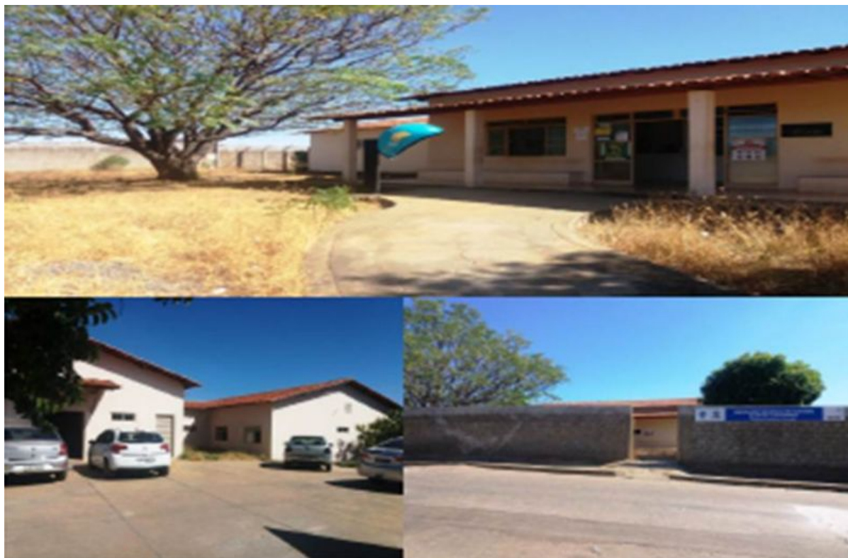
Figura 1. Unidade Básica de Saúde - ESF Santo Antônio.